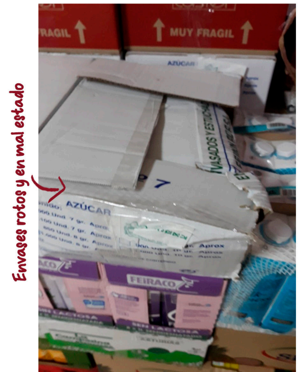
Envases rotos y en mal estado